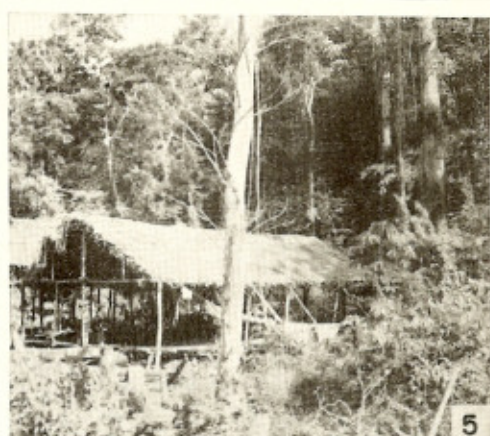
Fig. 2 — Derrubada de matas ao longo do percurso da Estrada de Ferro Amapá (localidade do Igarapé Cachorrinho). Fig. 3 — Derrubada e plantio às margens do rio Amapari (localidade do Igarapé Cachaca). Figs. 4 e 5 — Habitações de desmatadores da Fazenda Campo Verde. Notar a localização em íntimo contato com a floresta.

construção rudimentar, sem ou com poucas paredes, revestida de fôlhas de palmeira, próxima ou mesmo situada dentro da mata, torna-se facilmente acessível aos flebotomos transmissores. As Figs. 4 e 5 ilustram o que dissemos. Nelas estão representadas algumas casas de agricultores e derrubadores de mato. Pode-se verificar que as habitações são edificadas dentro da própria floresta. Todavia, é de se assinalar que esse tipo