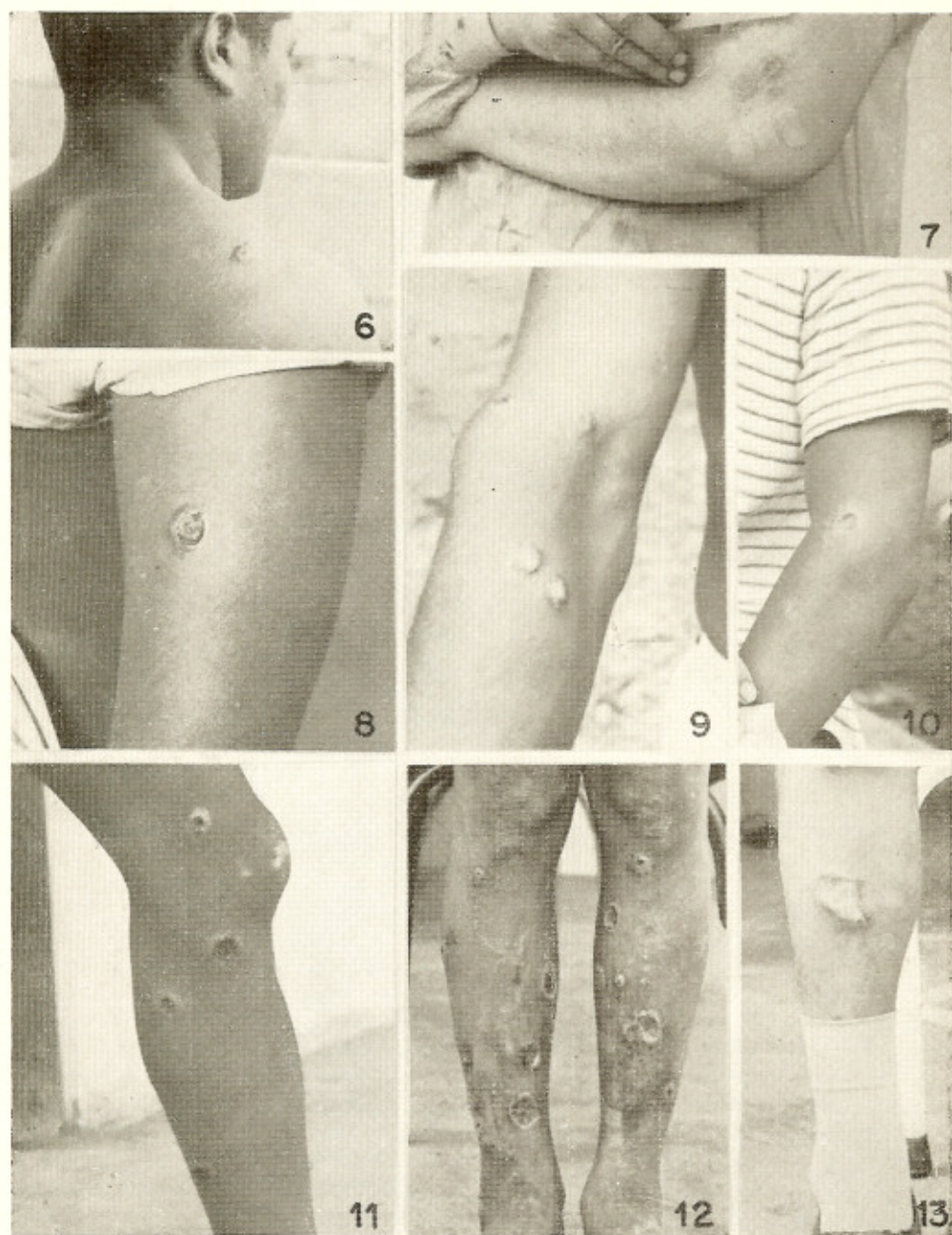
Figs. 6 a 13 — Lesões leishmanióticas: nas fotos 6 e 9, lesões de tipo pápulo-vesiculoso inicial; nas demais, ulcerações francas, sendo que na fig. 12 são vistas lesões em diferentes estádios evolutivos.