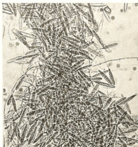
Fig. 4 — Micromorfologia do K. ajelloi nas "iscas".