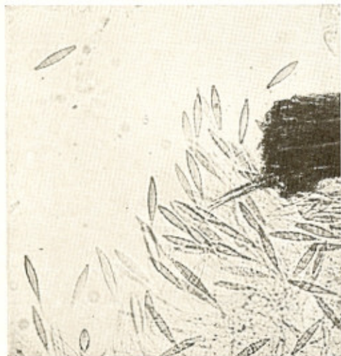
Fig. 2 — Micromorfologia do M. gypseum nas "iscas".