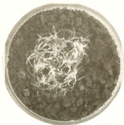
Fig. 1 — Crescimento do M. gypseum nas "iscas" de cabelo.

Pela primeira vez foram isolados do solo sulriograndense o M. gypseum e o K. ajelloi .