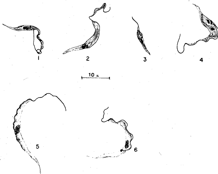
Prancha I — Infecção experimental de P. herreri por T. rangeli . Esfregação de hemolinfa após 41 dias de infecção. Figs. 1-3 — Epimastigotas. Fig. 4 — Epimastigota em divisão. Figs. 5-6 — Tripomastigotas longos. Desenhos em câmara-clara.