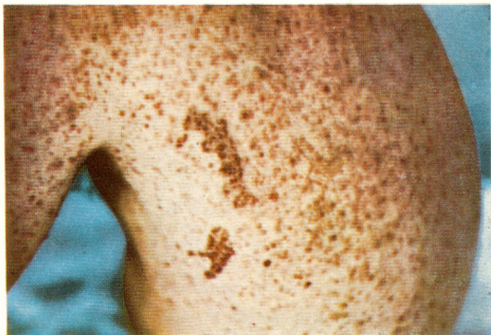
Fig. 1 — Comprometimento cutâneo generalizado (tronco) (caso CPPE)